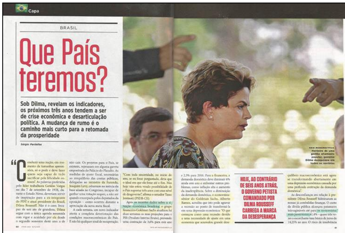
Figura 1 – Reprodução de matéria revista IstoÉ, 16 de dezembro de 2015