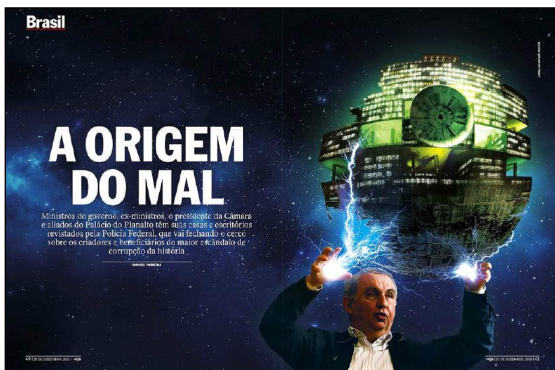
Figura 2 – Reprodução da matéria “A origem do mal”